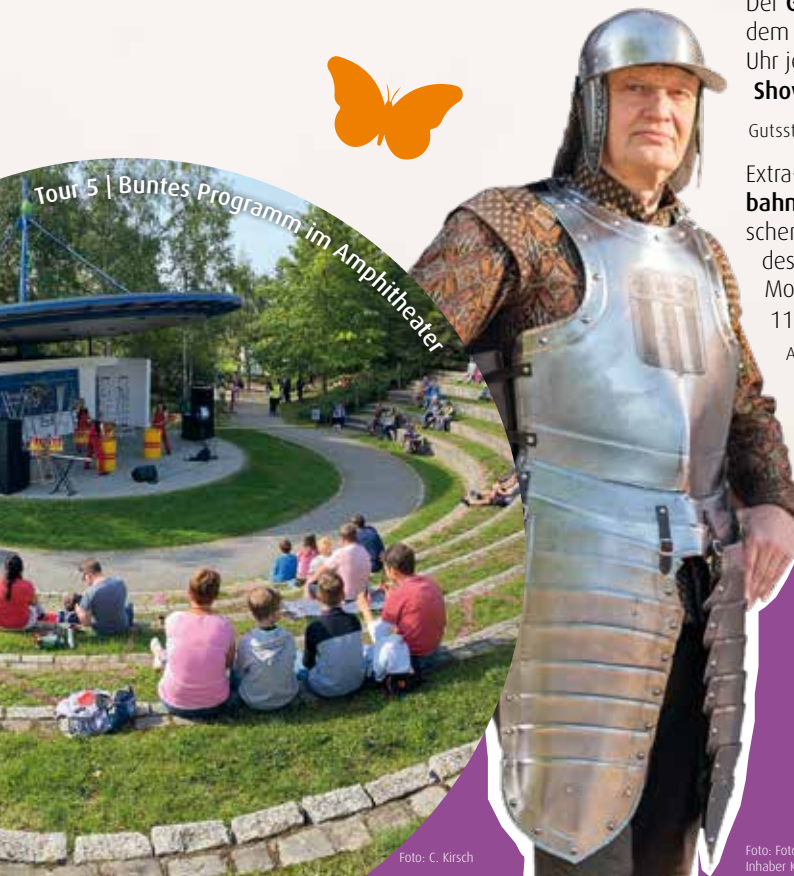
Tour 5 | Buntes Programm im Amphitheater

Pfeiffengrasstraße, 30855 Langenhagen / S-Bahn Linie S4; Buslinie 610, 611, Haltestelle „Kaltenweide/Bahnhof“